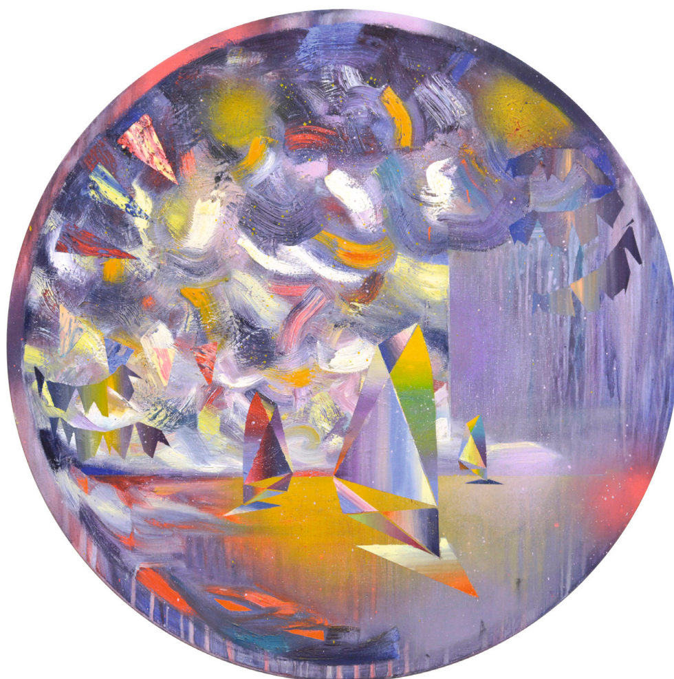
Trapez, 80 x 80 cm, Öl/Lack auf Leinwand, 2019