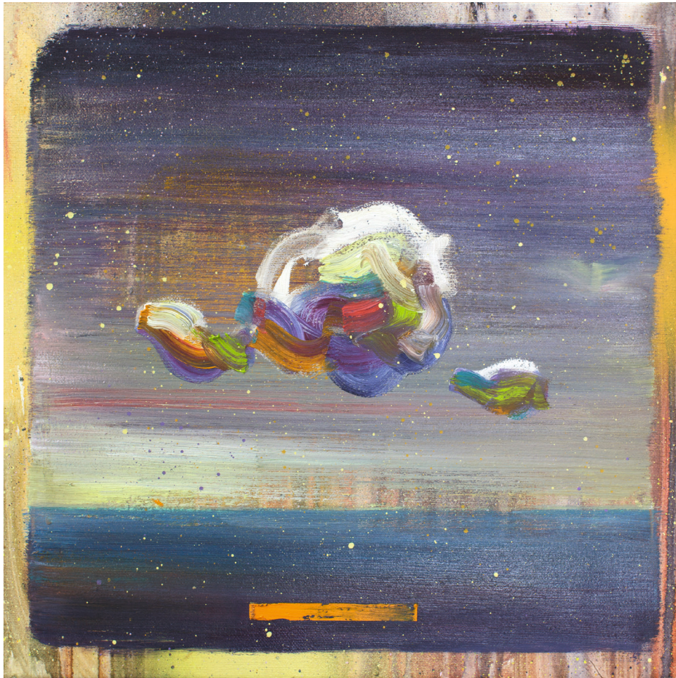
Sky Study III, 35 x 35 cm, Öl/Lack auf Leinwand, 2018