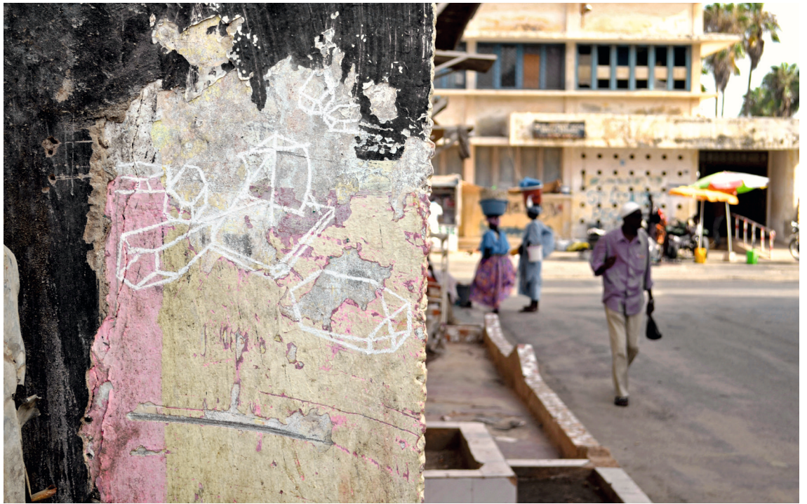
L'éphémère disparu (Rue Bisson), Kreide, Grafik im öffentlichen Raum, Saint-Louis, Senegal, 2013