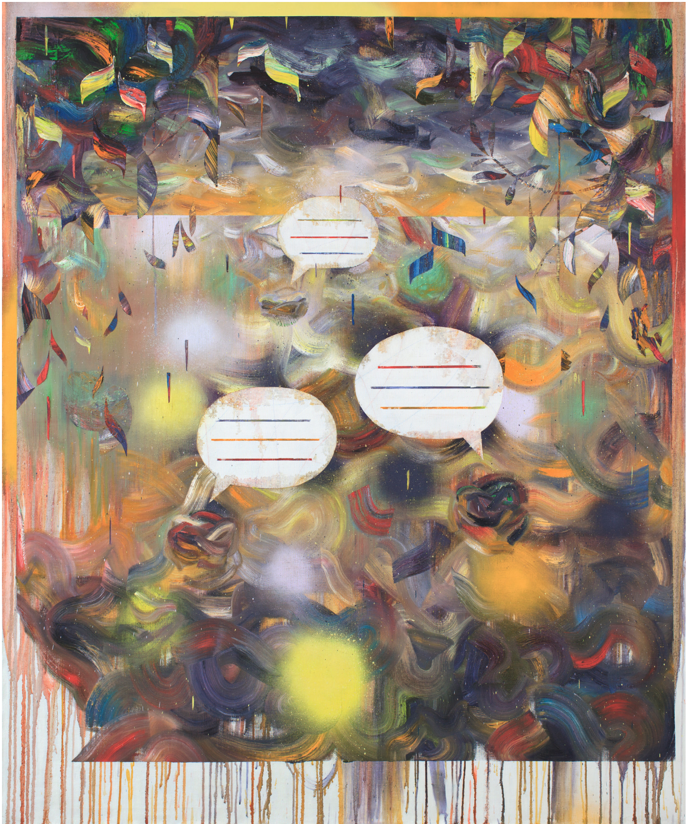
Blasen, 180 x 150 cm, Öl/Lack auf Leinwand, 2017