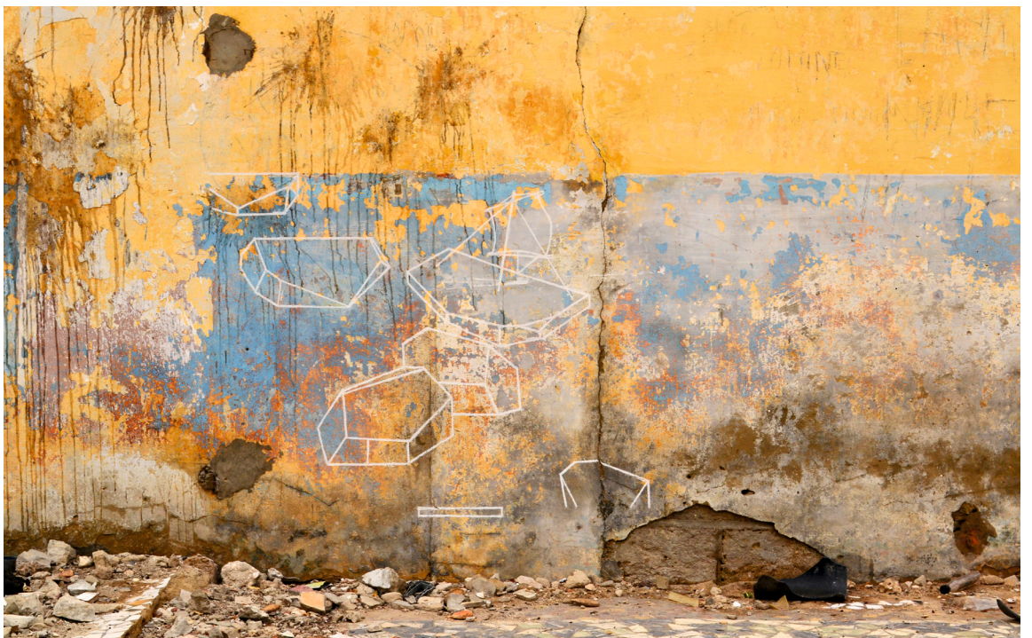
L'éphémère disparu (Rue Servant), Kreide, Grafik im öffentlichen Raum, Saint-Louis, Senegal, 2013