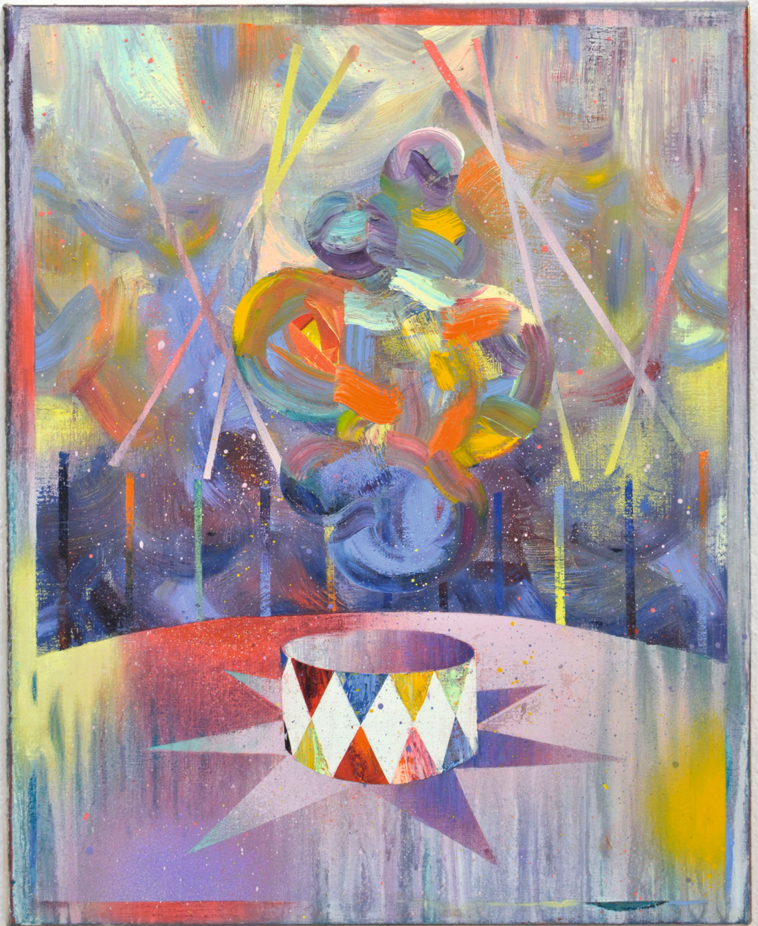
Manège, Artiste, je 50 x 40 cm, Öl/Lack auf Leinwand, 2019, Ausstellungsansicht Axel Obiger, Berlin