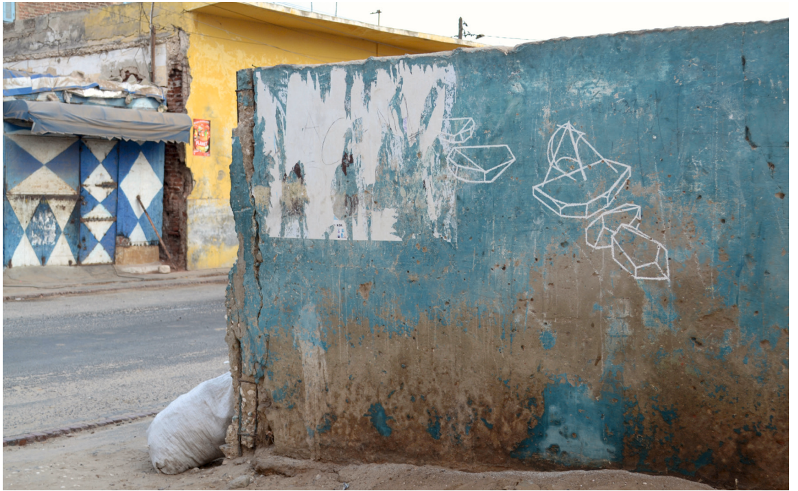
L'éphémère disparu (Rue Blaise Diagne), Kreide, Grafik im öffentlichen Raum, Saint-Louis, Senegal, 2013