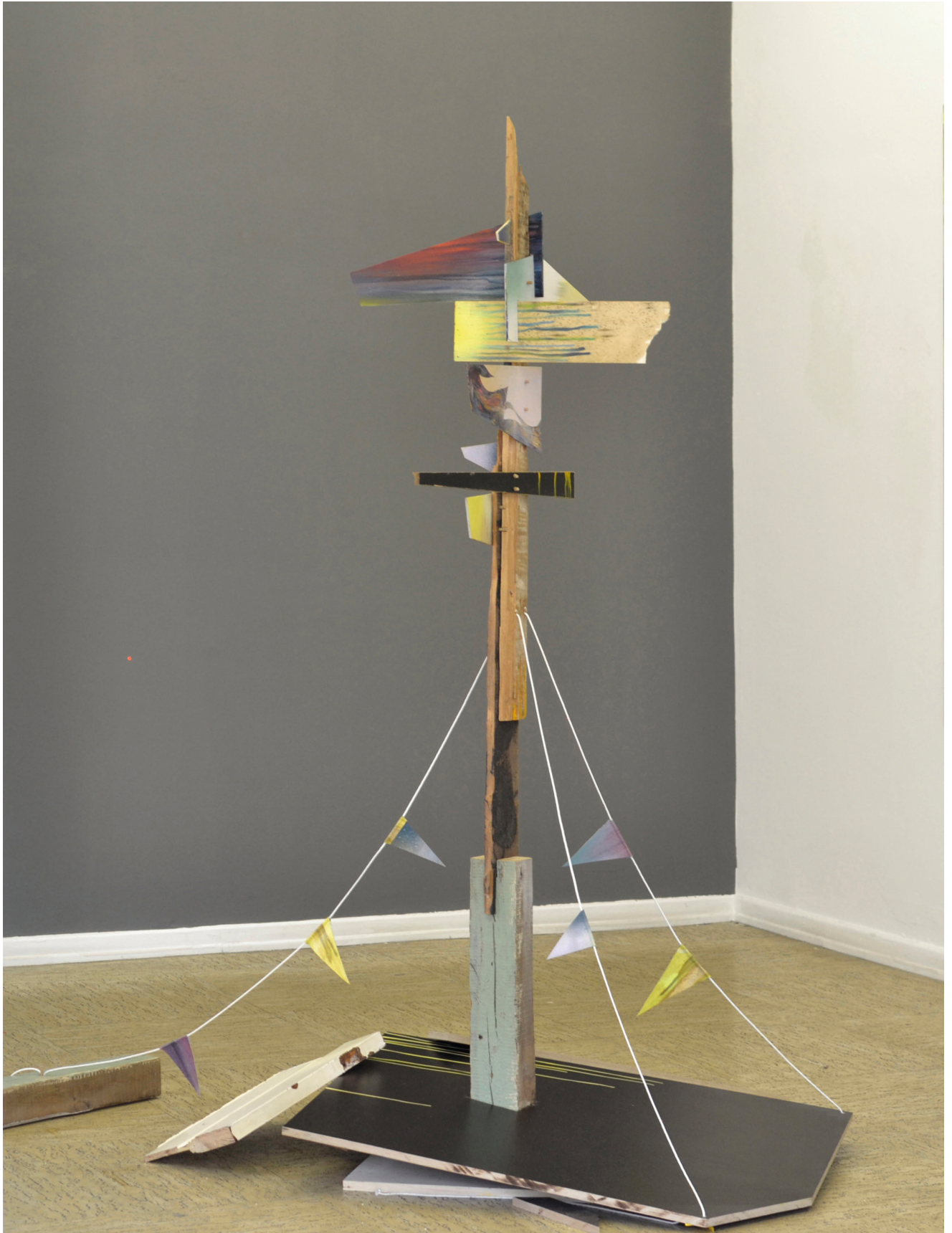
Pentimenti Panorama, Öl, Lack auf Holz und Leinwand, 160 x 140 x 40 cm, Ausstellungsansicht Galerie Greulich, Frankfurt/Main, 2015