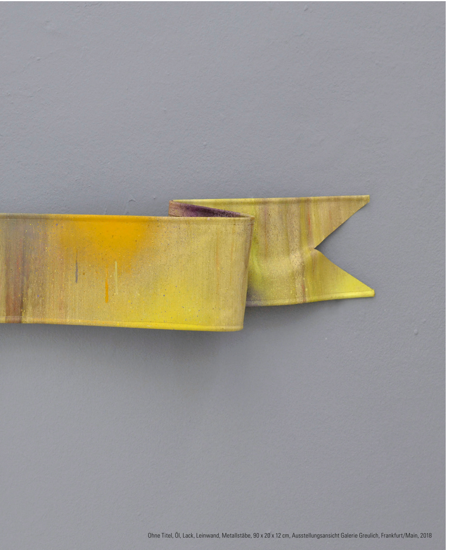
Ohne Titel, Öl, Lack, Leinwand, Metallstäbe, 90 x 20 x 12 cm, Ausstellungsansicht Galerie Greulich, Frankfurt/Main, 2018