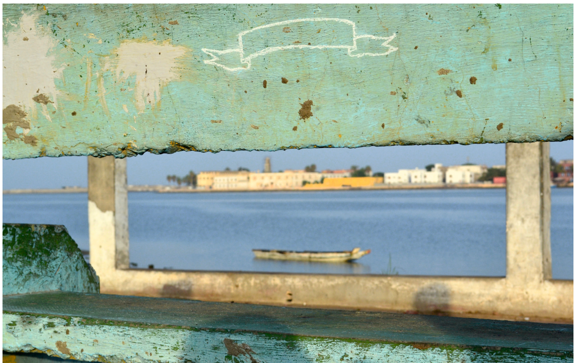
L'éphémère disparu (Sor, Corniche), Kreide, Grafik im öffentlichen Raum, Saint-Louis, Senegal, 2013